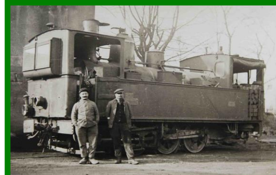
Restauration de la locomotive